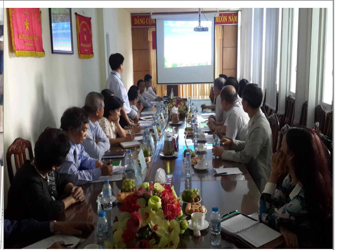
호치민시 천연자원환경국 장사시설 설명