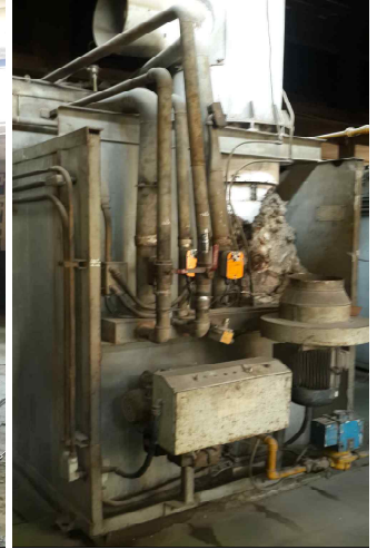
Binh Hung Hoa 화장장(2)