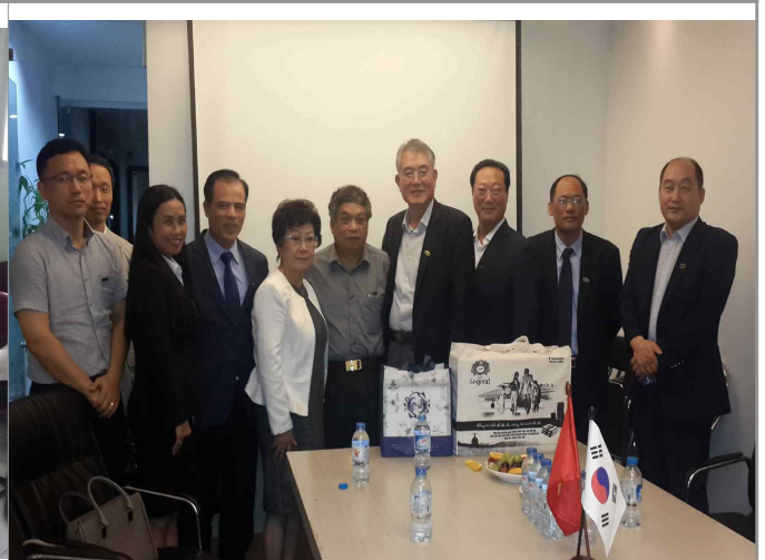
재향군인회 본사 방문