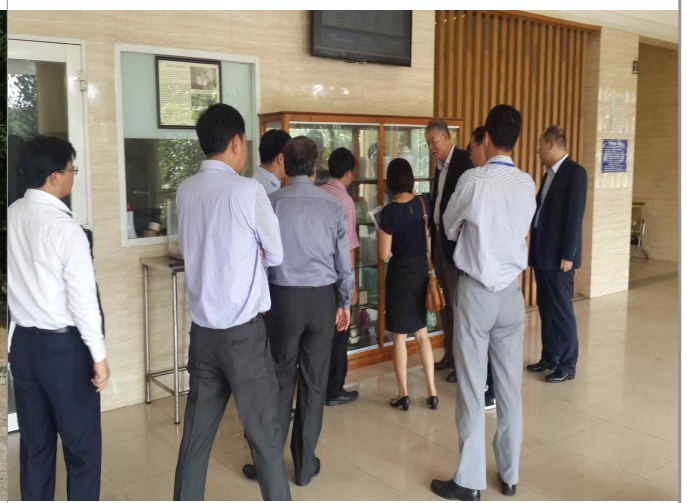
Binh Hung Hoa 화장장(1)