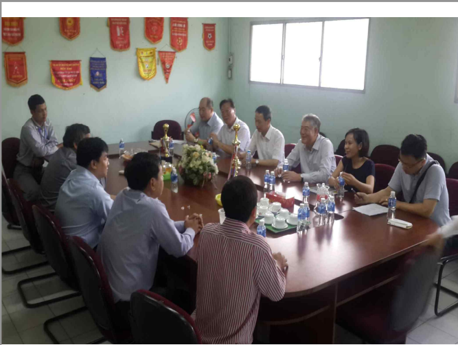
Binh Hung Hoa 화장장(3)